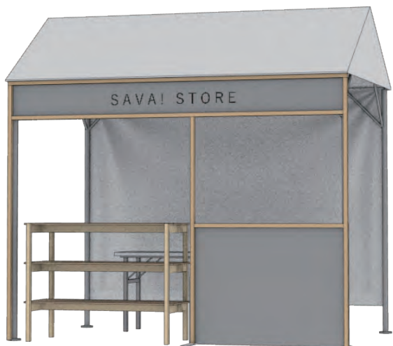
1ブースの基本設備