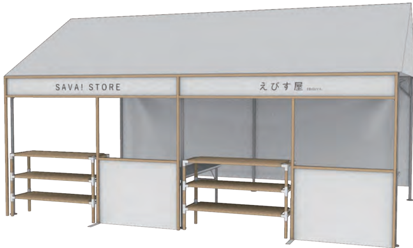
1ブースの基本設備